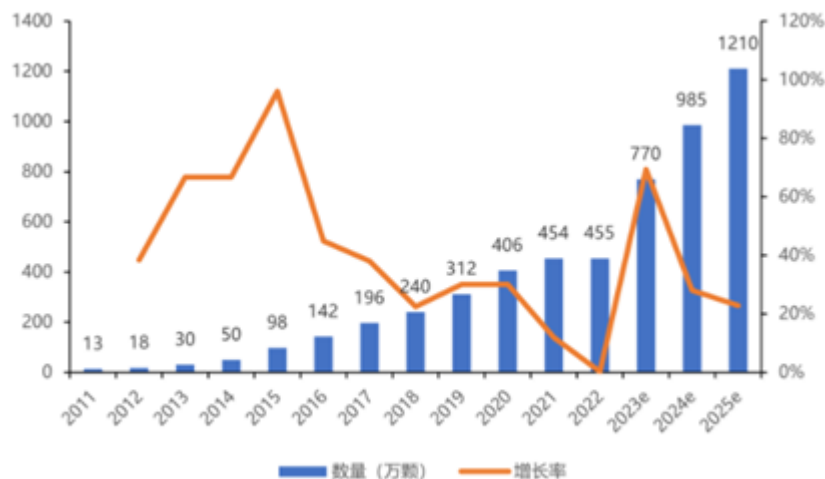
图二 我国种植牙服务市场规模及增速

截至 2024 年 4 月，种植牙集采政策全面执行已逾一年，单颗常规口腔种植牙的整体费用大大降低，显著缓解患者的医疗负担。随着集采政策的实施，公立和民营口腔医疗机构之间的价格差异缩小，民营口腔行业竞争愈发白热化。种植修复材料虽然未被纳入集采范围，但也受到需求波动和下游终端降本控费的影响。2022 年我国种植牙数量约为 455 万颗，从长期来看，我国种植牙渗透率仍有较大的提升空间，种植修复材料的需求将随着种植牙数量的增长而不断提升。