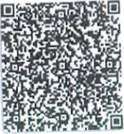
贺爱雅的证书二维码.png

本证书经检验合格, 继续有效一年。 This certificate is valid for another year after this renewal.