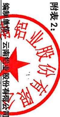
附表 2: 2021 年非公开发行股票募集资金使用情况对照表 2024 年 12 月 31 日