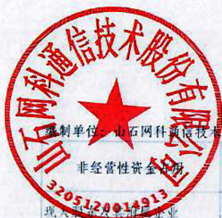
山石网科通信技术股份有限公司2024年度非经营性资金占用及其他关联资金往来情况汇总表