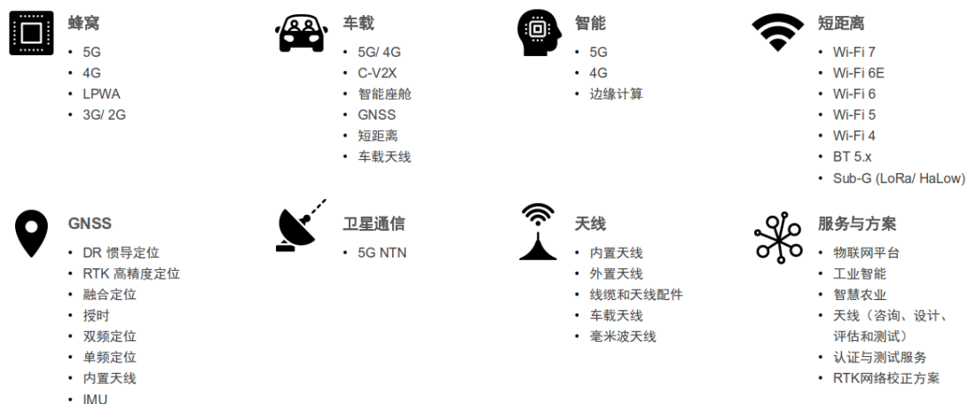
图 公司产品与服务

公司主营业务是从物联网领域无线通信模组及其解决方案的设计、研发、生产与销售服务，可提供包括无线通信模组、天线及软件平台服务等在内的一站式解决方案，公司拥有的多样性的产品及其丰富的功能可满足不同智能终端市场的需求。